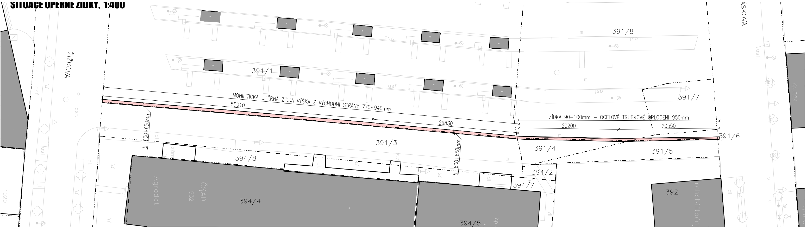
SITUACE OPĚRNÉ ZIDKY, 1:400