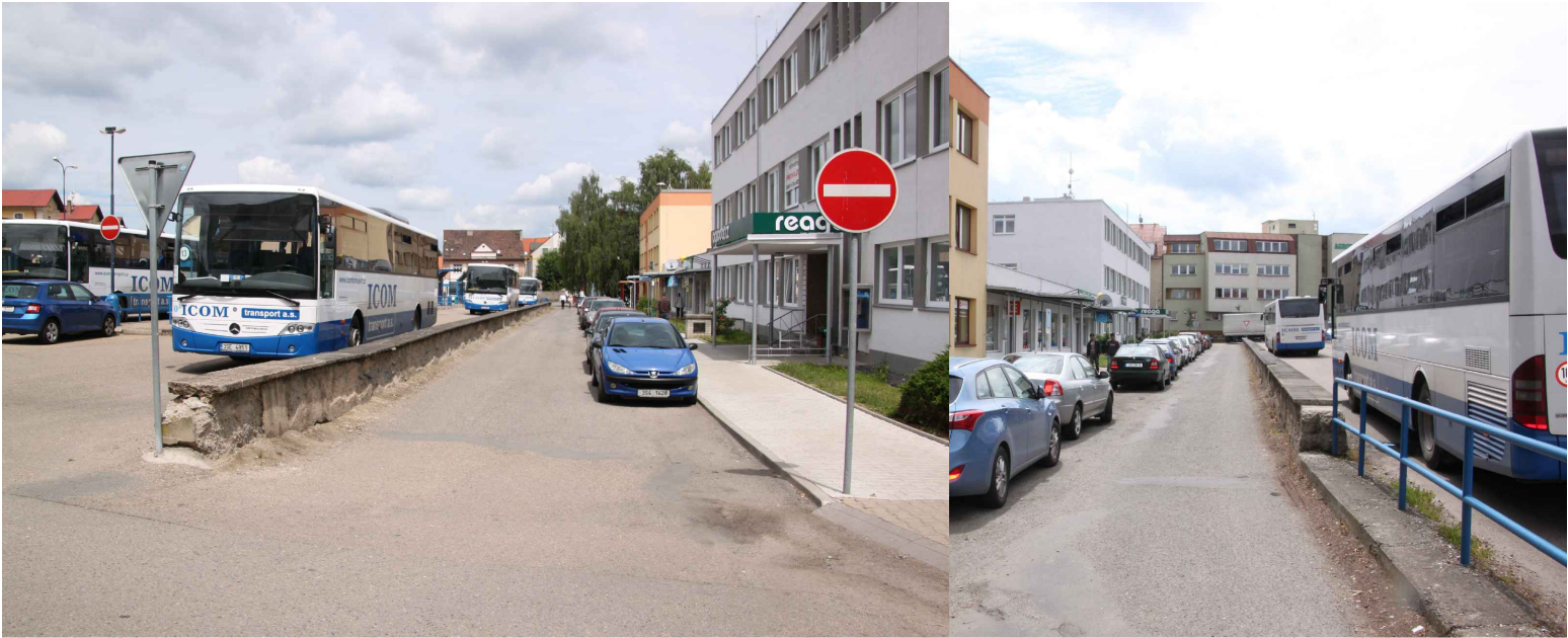
POHLEDY Z VÝCHODNÍ STRANY NA OPLOCENÍ A NA OPĚRNOU ZÍDKU, 1:50